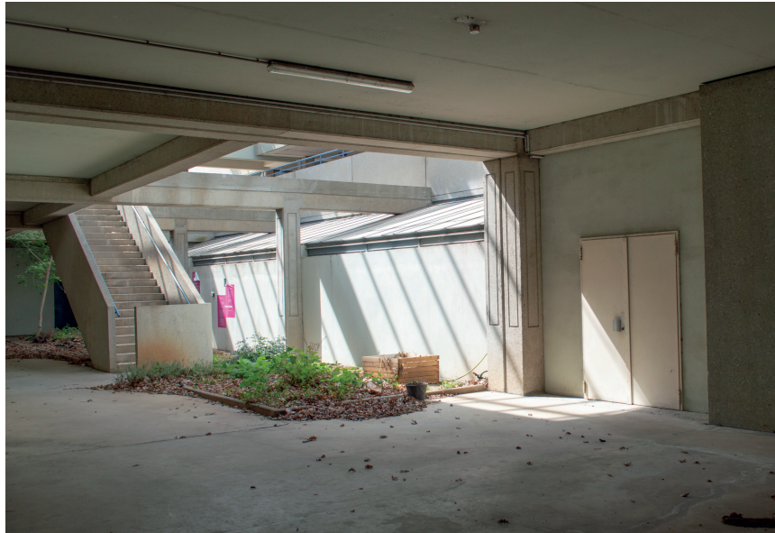
L'entrée des Ateliers du CAP, bordant le jardin