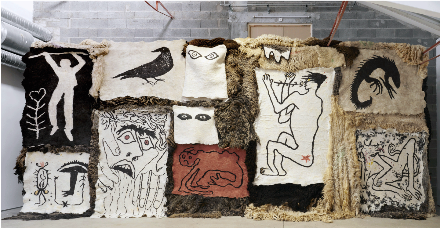
Toison d'or , laine de mouton, teintures naturelles de Inès Agathe Maud, bois, farine, 920×400 cm, 2022. Exposition Les eaux souterraines surgissent à l'air libre, Comfort Moderne, Poitiers.