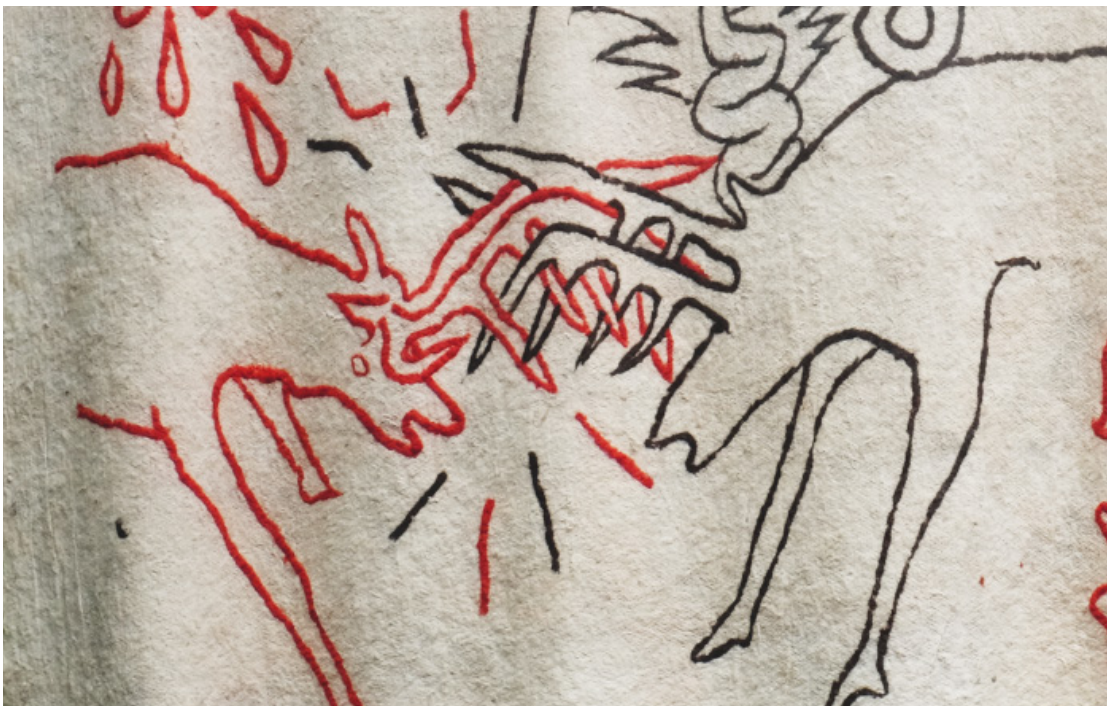
Lan Lhotar (détail), 2023. Le Vent des Forêts, Fresnes-au-Mont.

Sur inscription à : apalade@saint-fons.fr