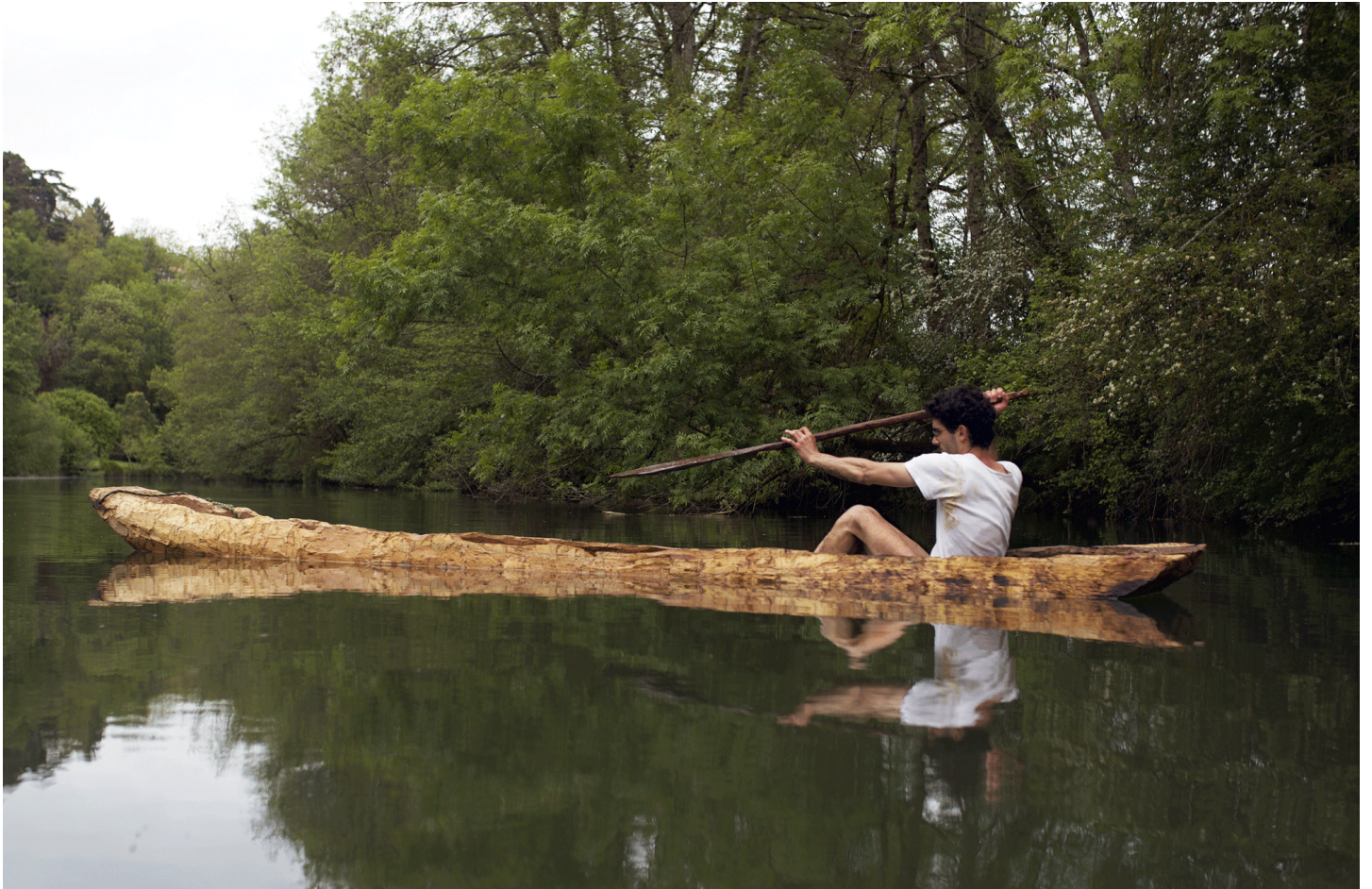
Pirogue monoxyde , bois, 50 × 50 × 550cm, Poitiers, 2019.

→ Vidéo de la fabrication de l'œuvre (6mn12sec)