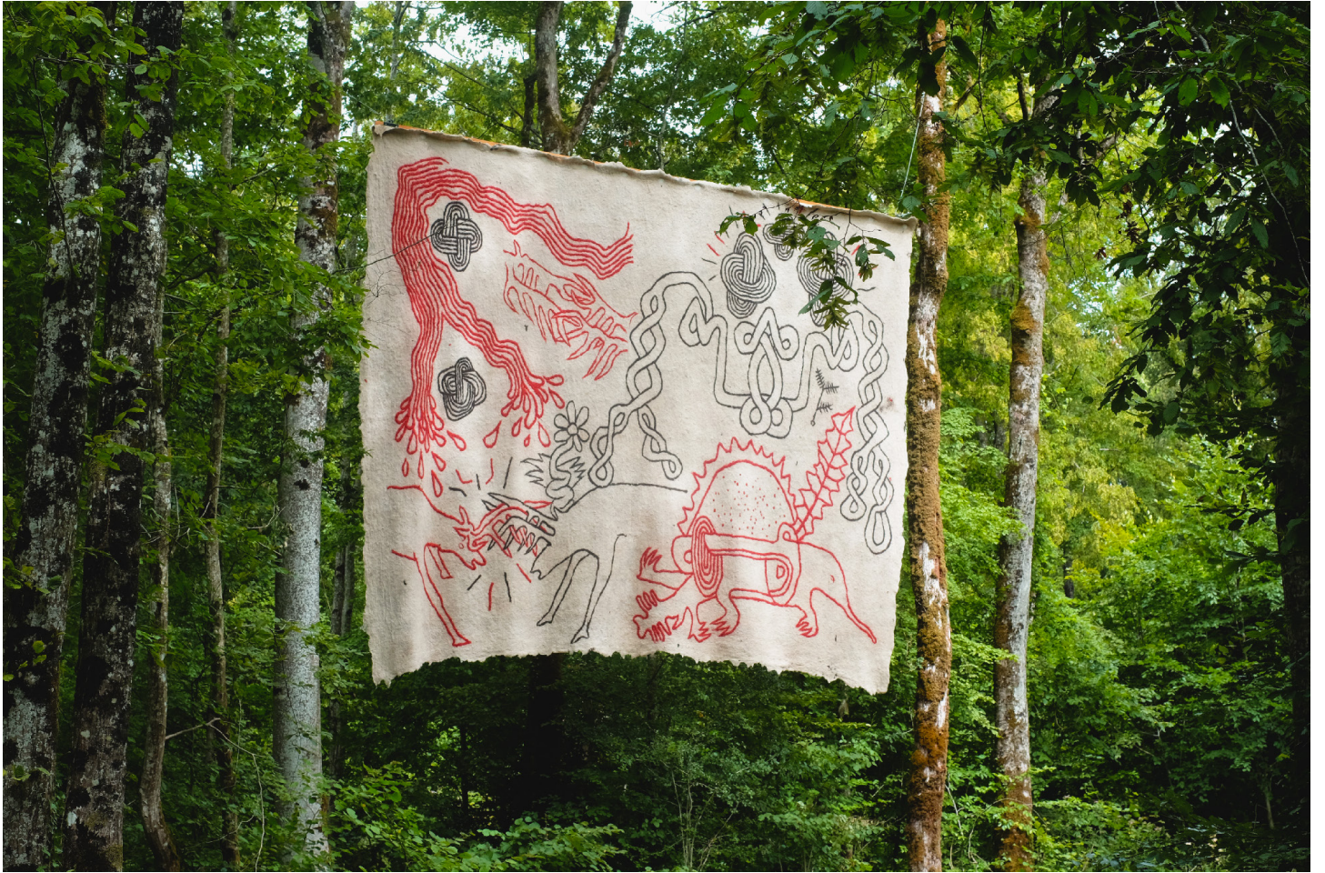
Lan Lhotar, 2023. Le Vent des Forêts, Fresnes-au-Mont.