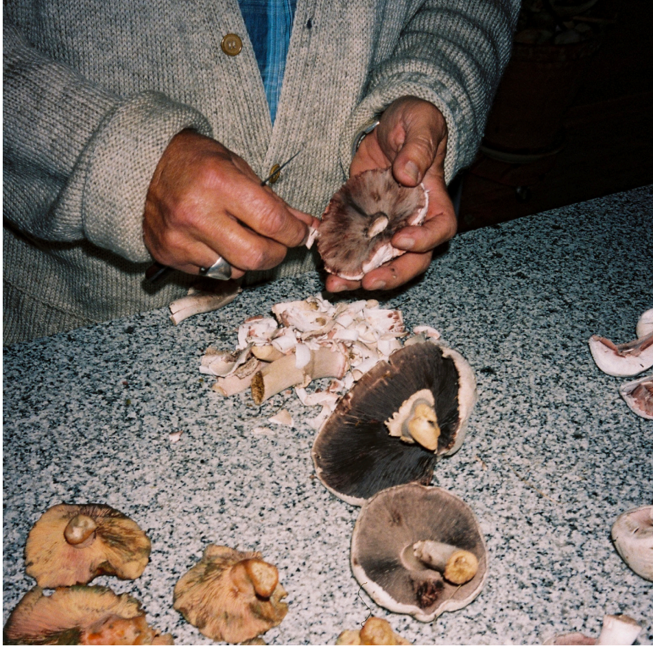
Image : Lactaires délicieux et rosés des prés, photographie argentique, Théophile Peris, 2024.