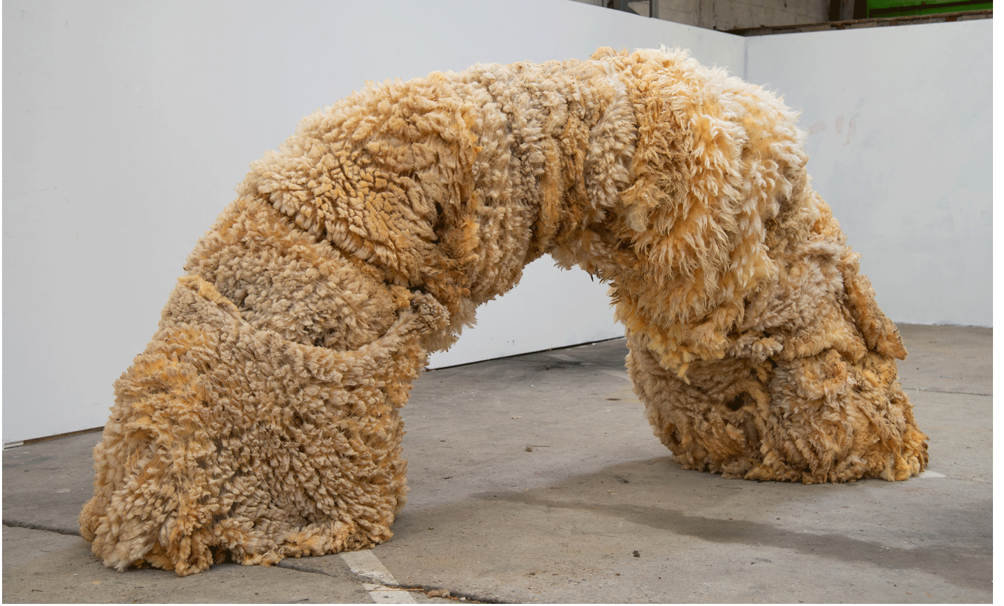
Pièce d'atelier, 2021. EESI - Ecole Européenne Supérieure de l'Image, Poitiers.