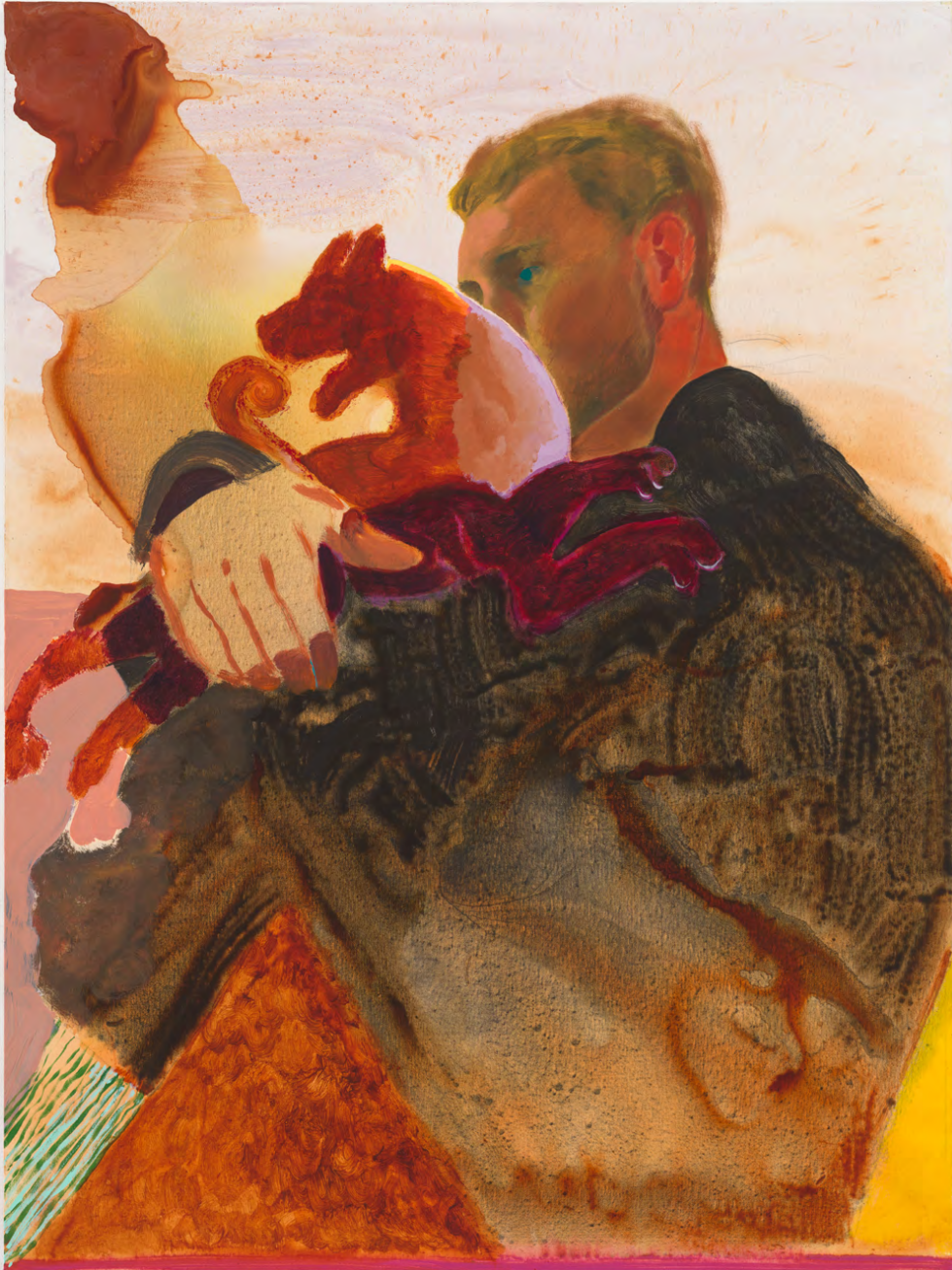
Holding a lion (détail), acrylique et huile sur toile, 122×91.4×3.2cm, 2024.