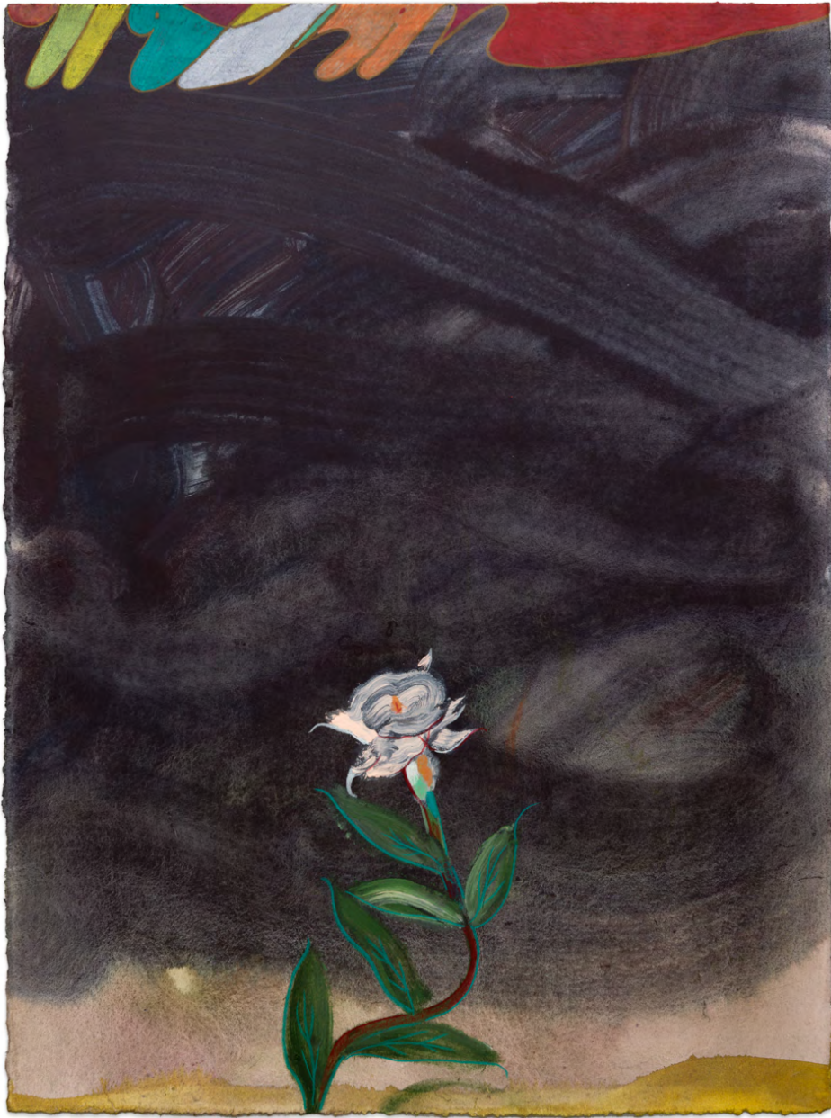
Moonflower (within) (12) , crayon de couleur et acrylique sur papier, 76,5×57cm, 2024.

Dessin issue de la nouvelle série exposée au CAP • Centre d'art pour l'exposition Like Night Needs Morning , 2024.