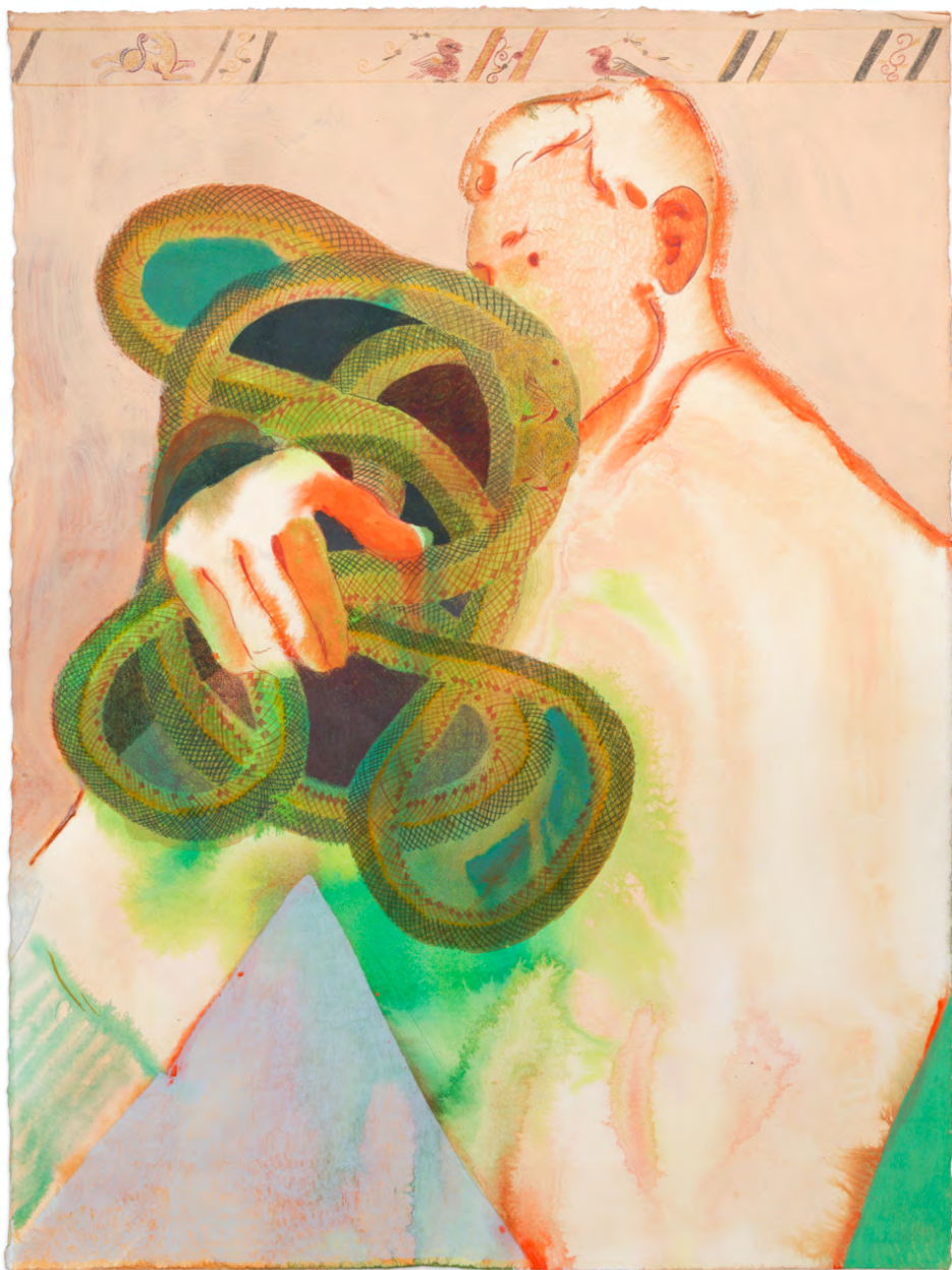
Holding snake bundle (Bayeux strip) (23) , crayon de couleur et acrylique sur papier, 76,5×57cm, 2024.

Dessin issue de la nouvelle série exposée au CAP • Centre d'art pour l'exposition Like Night Needs Morning , 2024.