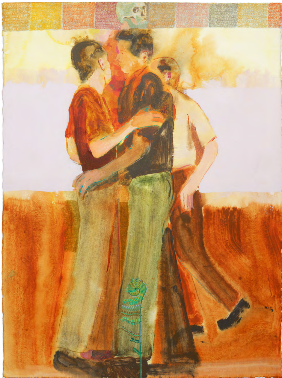
Three entwined (skull and fern) (5) , crayon de couleur et acrylique sur papier, 76,5×57cm, 2024. Dessin issue de la nouvelle série exposée au CAP • Centre d'art pour l'exposition Like Night Needs Morning , 2024.