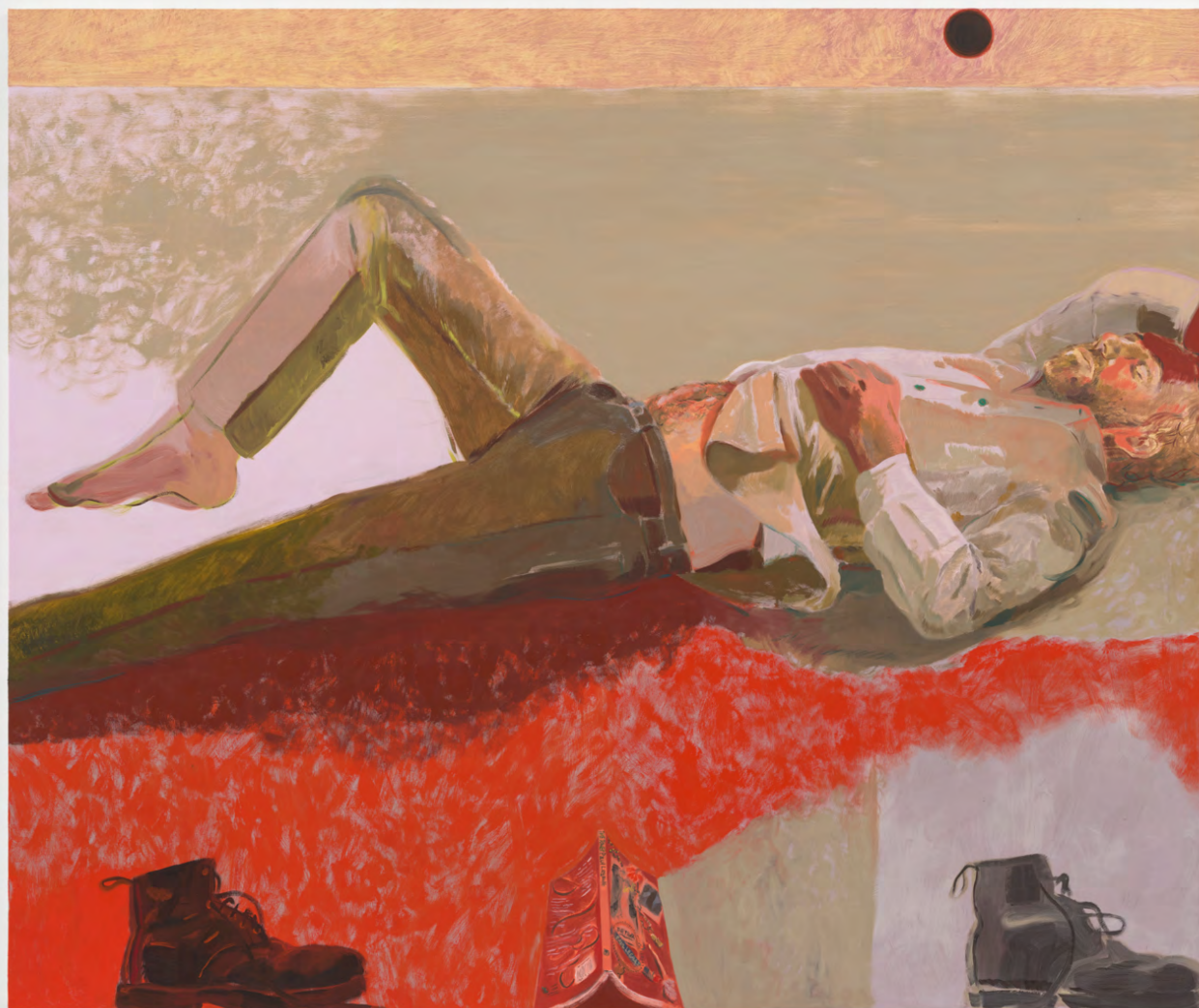
The Poet (Paul Legault after Matisse's homoerotic sketch of Derain) , huile sur toile, 152×183cm, 2023.