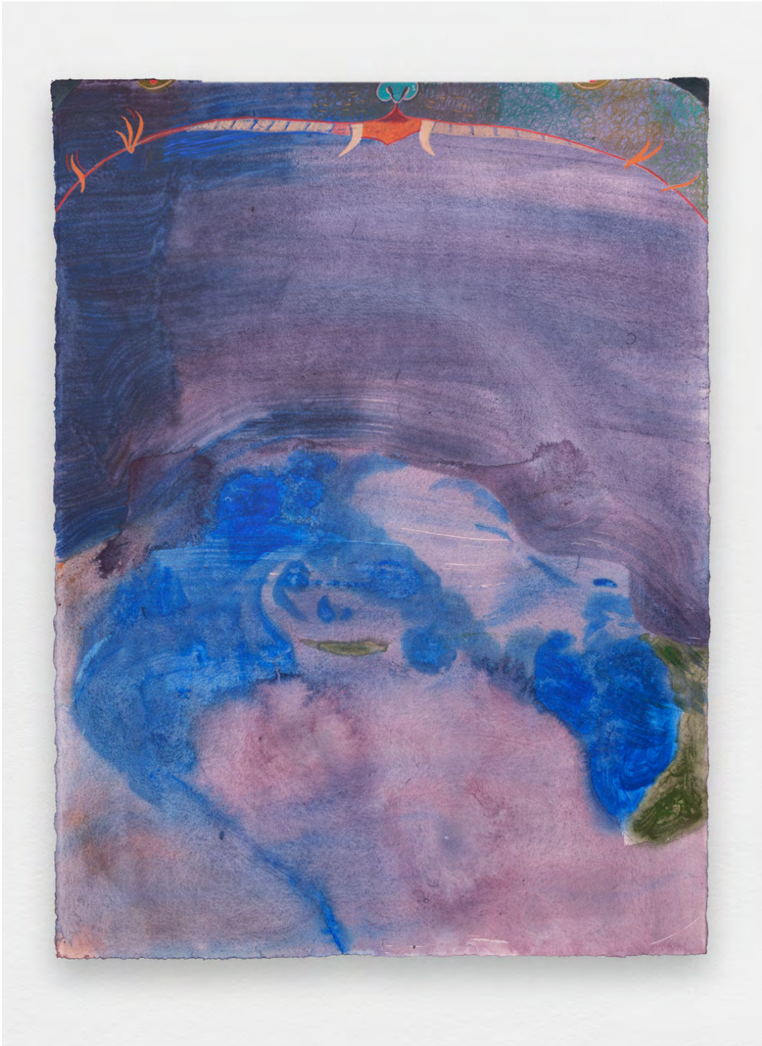
Dreamer and Hellmouth ii (16) , crayon de couleur et acrylique sur papier, 76,5×57cm, 2024.

Dessin issue de la nouvelle série exposée au CAP • Centre d'art pour l'exposition Like Night Needs Morning , 2024.