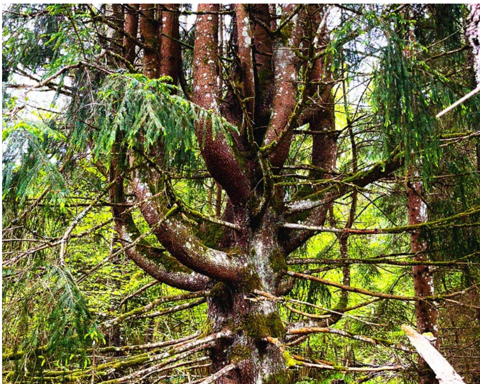
Image : Epicetum communis remarquable photographié le long du G30, Auvergne.

→ Mercredi 18 septembre de 9h30 à 12h accueil presse, visite de l'exposition et petit-déjeuner