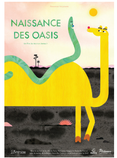
Naissance des oasis , 2021, Court métrage d'animation, 10'