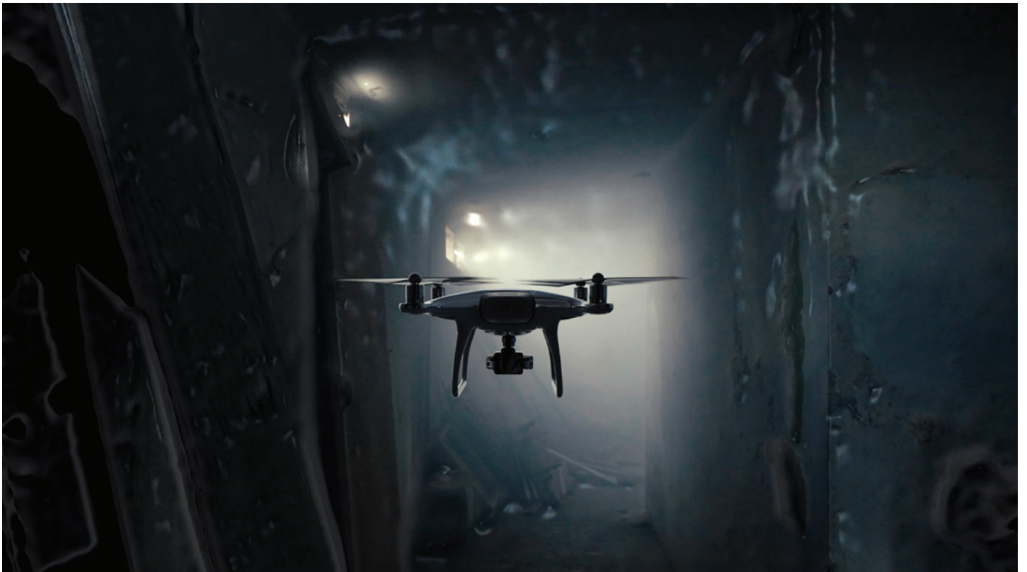
Fantasma, animal , Clemente Castor, Mexique, 2021, 16'

Clemente Castor est un artiste mexicain pluridisciplinaire : réalisateur, peintre, monteur et photographe, il réalise principalement des films expérimentaux et documentaires. Diplômé en littérature latino-américaine, il a bénéficié du soutien du FONCA pour étudier le cinéma à l'Académie du film de Sarajevo. Son travail explore des thèmes tels que la mémoire, l'espace et l'identité, avec une approche visuelle et narrative souvent contemplative.