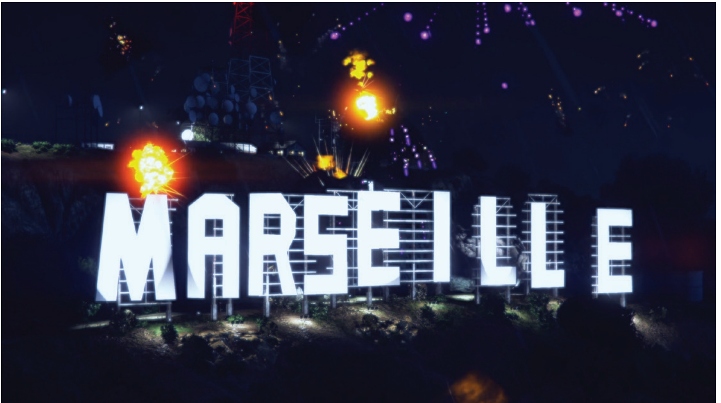
Khtobtogone, 2021, 16'

Diplômée de l'École des beaux-arts de Bordeaux en 2018 avec les félicitations du jury, elle est une artiste plasticienne dont le travail combine vidéo, performance musicale et photographie. Son inspiration provient de la musique, de la mode, des réseaux sociaux et de la science-fiction. À travers ses créations, elle explore la culture «beurcore», un terme qu'elle utilise pour désigner la jeunesse des quartiers populaires issue de la diaspora maghrébine. Imprégnée des codes de la culture de banlieue, son œuvre interroge les notions d'appartenance, d'adolescence et de masculinité. Par des récits fictifs filmés et performés, oscillant entre documentaire et science-fiction, elle documente et déconstruit les mythologies sociales qui façonnent ces identités.