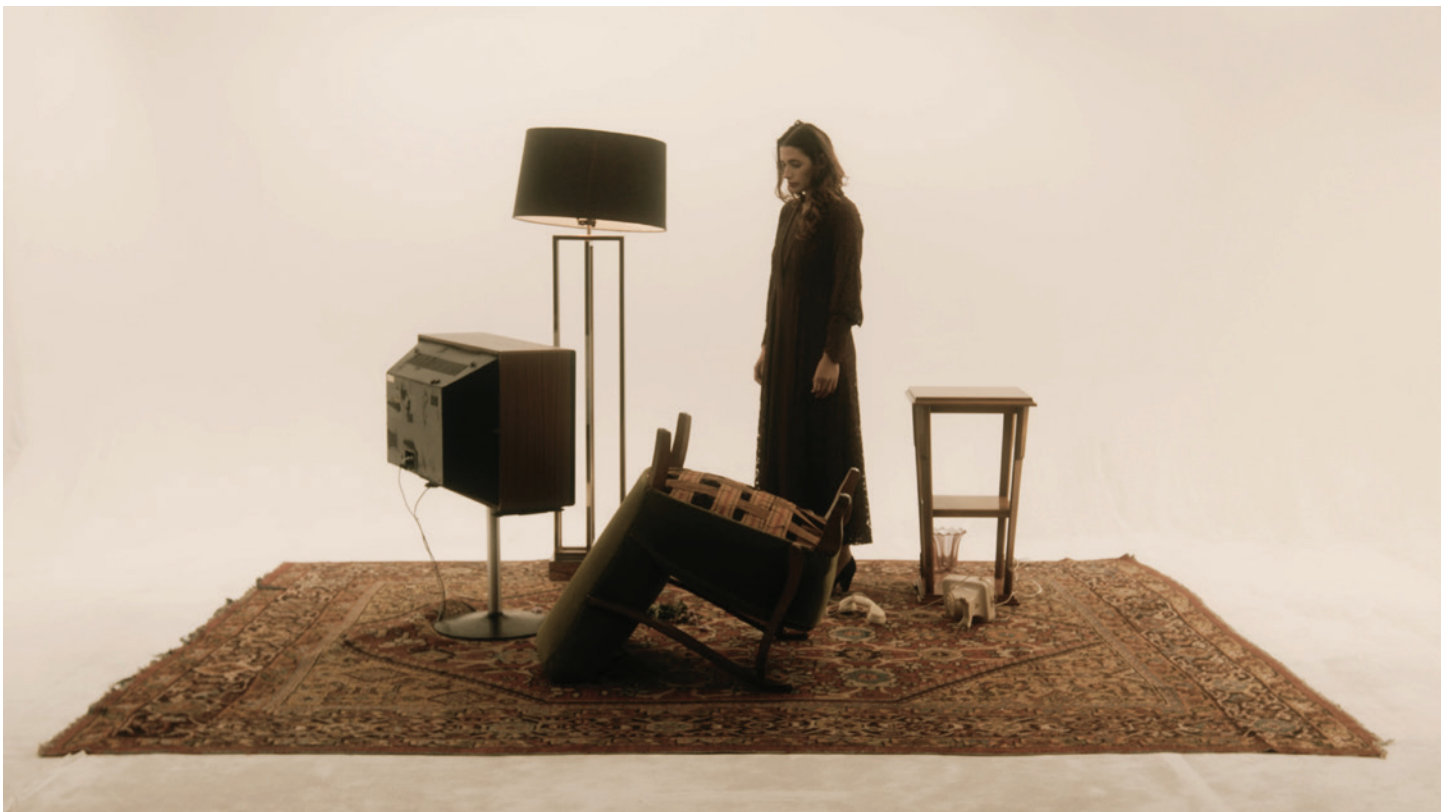
Capital , Palestine, Égypte, Italie, Allemagne, 2023, 17'

Artiste et cinéaste palestinienne, son parcours nomade l'a menée à travers le Moyen-Orient, l'Europe et l'Amérique du Nord. Elle explore la récurrence cyclique des conflits politiques et interroge l'héritage du colonialisme à travers des créations satiriques, immersives et lyriques. Son travail mêle archives, fiction et expérimentations formelles, et nous invite à une réflexion critique sur l'Histoire et la mémoire. En 2024, elle est nommée au Prix Aware.