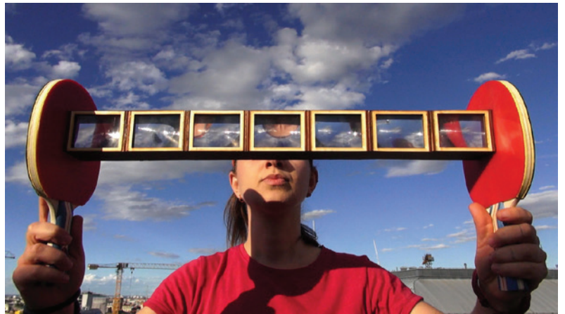
Muybridge's Disobedient Horses , 2018, animation, Australie, 5'

Elle travaille actuellement à la conception et à la construction de mécanismes innovants pour produire des vidéos et des films.