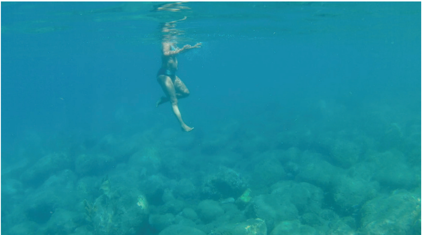
The Lenght of my Gaze at Night , France, 2023, 9'

Diplômée de l'École nationale supérieure des beaux-arts de Lyon, Minia Biabiany est une artiste plasticienne et vidéaste. Son travail explore le territoire et les récits caribéens, en interrogeant l'histoire coloniale et les liens entre langage, corps et espace, s'appuyant sur une pratique qui combine installations et vidéos. Dans ses œuvres, elle utilise le tissage comme métaphore des structures narratives et linguistiques. En 2016, elle initie le projet collectif Semillero Caribe à Mexico et poursuit ses recherches pédagogiques en Caraïbe avec Doukou , une plateforme expérimentale liant concepts d'auteurs caribéens, corps et ressentis.