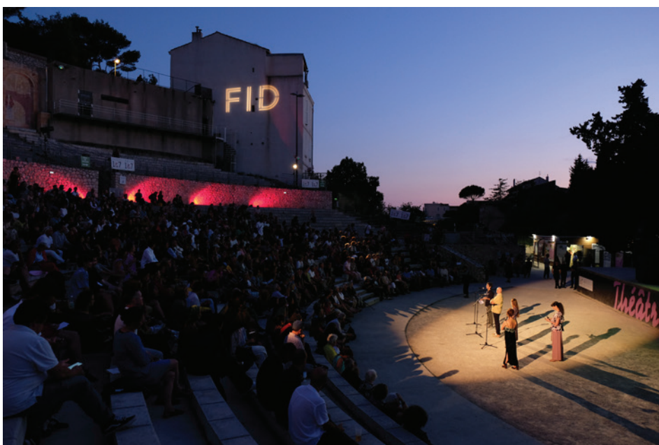
Soirée d'ouverture du FIDMarseille au théâtre Silvain, 2023.

Le FIDMarseille est un festival international de cinéma organisé chaque année, au début de l'été, au cœur de Marseille. Une centaine de films, fictions et documentaires, films d'artistes, courts et longs-métrages composent sa programmation. Attentif aux écritures singulières et aux formes émergentes, le FIDMarseille est un festival de référence pour le cinéma indépendant, internationalement reconnu pour l'importance de son travail de défrichage et de découverte de nouveaux talents. En parallèle de chaque édition ont lieu le FIDLab, plateforme de coproduction internationale, ainsi que le FIDCampus, résidence de formation à destination des étudiant-es d'écoles d'art et de cinéma des pays méditerranéens. Le FIDMarseille rend hommage à des grandes figures du cinéma ou de l'art contemporain en leur consacrant d'amples rétrospectives dans le cadre de ses éditions. En 2025, le cinéaste roumain Radu Jude sera l'invité de la 36e édition qui se tiendra du 8 au 13 juillet.