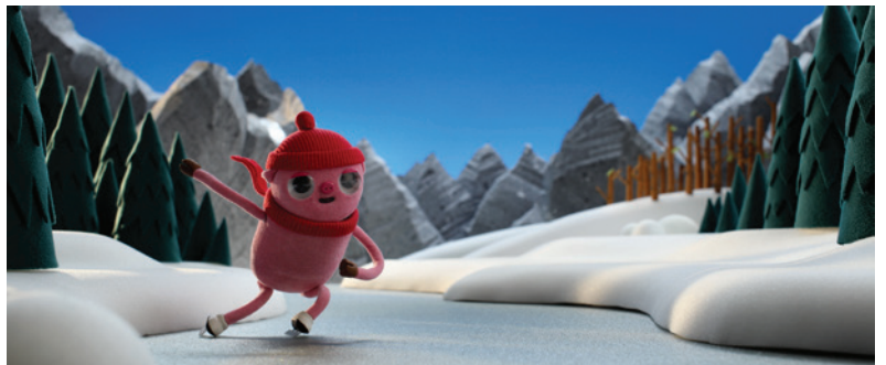
Hoofs on Skate , 2024, Stop motion, 13'

Né en 1985 à Vilnius, il a obtenu un diplôme d'ingénieur et d'informatique à la VGTU (Vilnius). Après cela, il a travaillé comme animateur 3D et a créé des designs sonores et visuels pour des productions théâtrales et cinématographiques. Avec un intérêt particulier pour le stop-motion, il a commencé à travailler comme animateur puis comme réalisateur, sortant son premier court-métrage, Woods , en 2015 et remportant le prix national du meilleur court-métrage. Il possède désormais son propre studio de stop-motion à Vilnius.