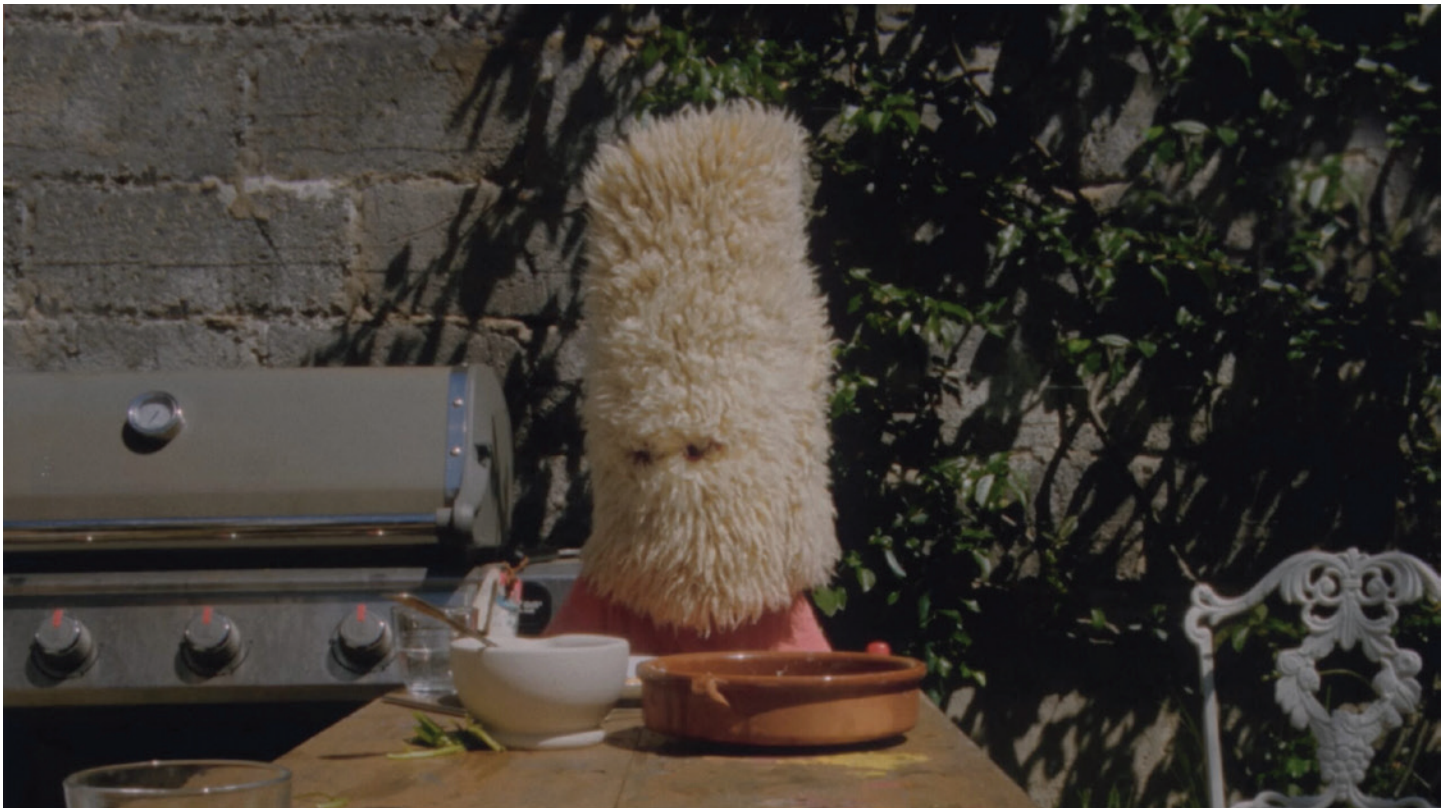
Leisure, Utopic , UK, 2024, 2'