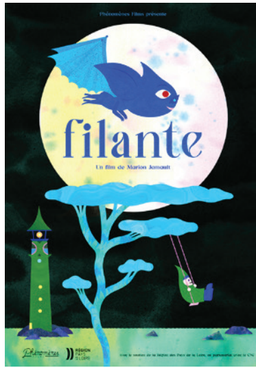
Filante , 2023, court métrage d'animation, 8'