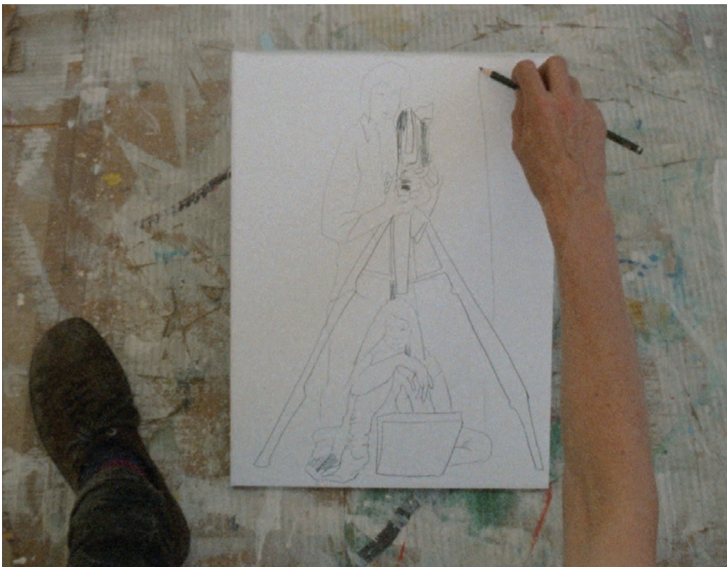
Real Time , Autriche, 2022, 5'

Son travail, souvent minimaliste et conceptuel, s'intéresse aux espaces et à leur perception, interrogeant les limites du documentaire et de la fiction. Enseignante à l'Académie des Beaux-Arts de Vienne, elle a présenté ses œuvres dans de nombreux festivals et galeries internationales. À travers ses films, elle invite à une réflexion sur la matérialité du monde et la construction du regard.