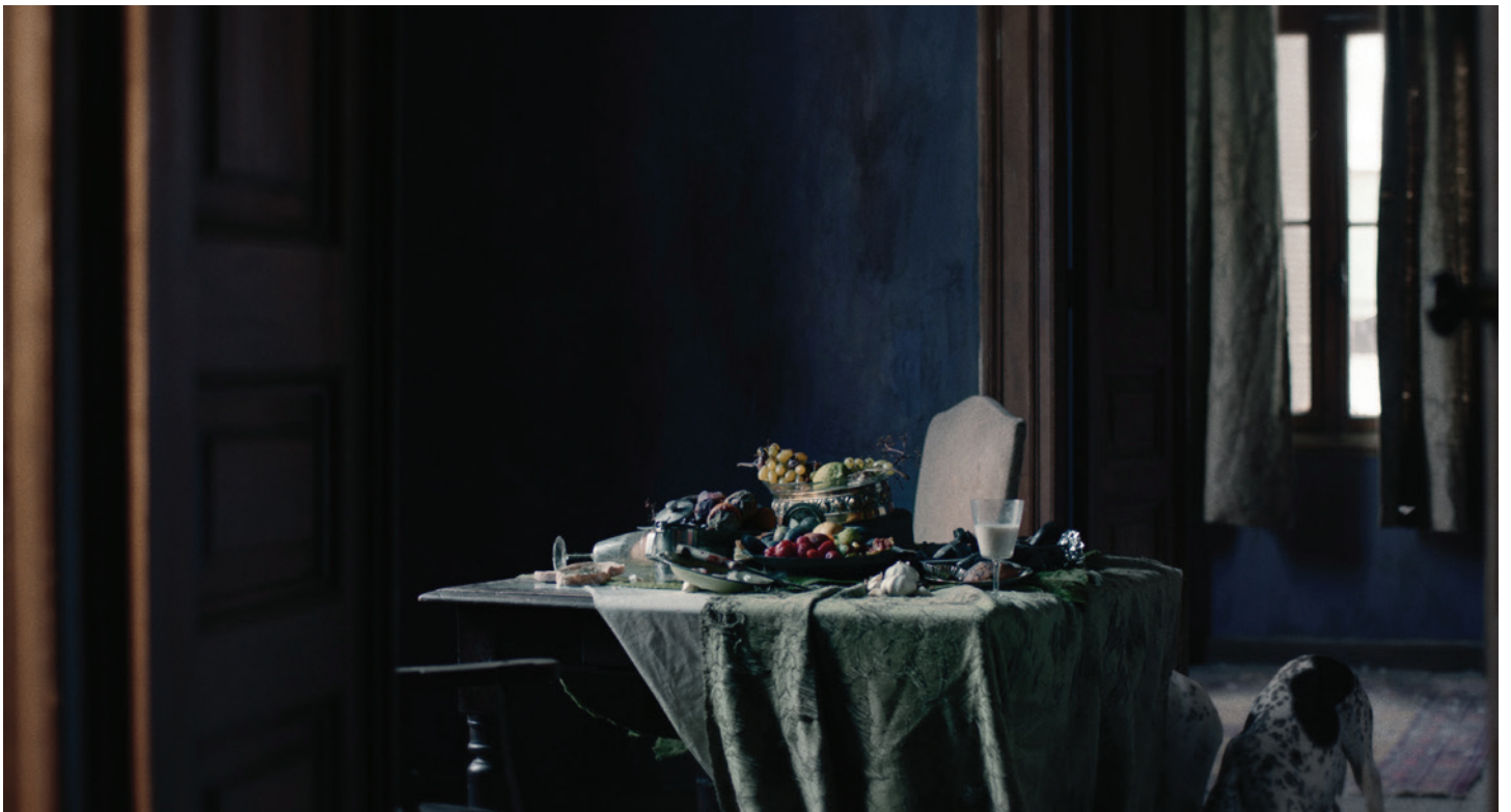
Lacerate , Janis Rafa, Italie, 2020, 16'

Son travail mêle cinéma, art vidéo et installation immersive pour explorer des thèmes qui semblent contradictoires comme l'amour – la domination ou encore la moralité – la perte à travers les relations entre humains et animaux, humains et non humains. Ses films, souvent contemplatifs et poétiques, se situent à la frontière entre réalité et fiction, capturant des paysages empreints d'errance et de mélancolie. Diplômée des Beaux-Arts de Leeds, elle a exposé et projeté ses œuvres dans des festivals et institutions prestigieuses comme la Biennale de Venise ou le Festival international de Rotterdam. Son univers visuel sensible interroge les liens invisibles entre le vivant et l'inanimé.